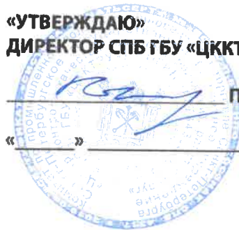
СХЕМА РАЗМЕЩЕНИЯ ТОРГОВЫХ МЕСТ НА ТЕРРИТОРИИ РЕГИОНАЛЬНОЙ ЯРМАРКИ